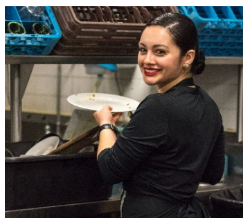
接触脏盘子或设备