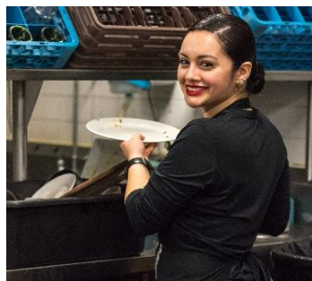
Tocar platos y utensilios sucios o el equipo