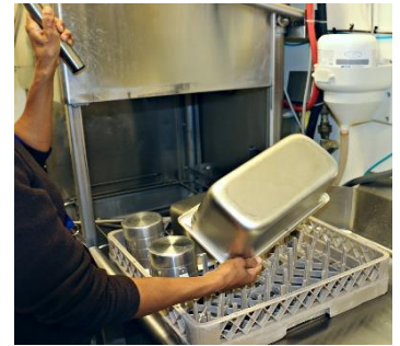
Tocar utensilios limpios