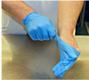
Ponerse los guantes