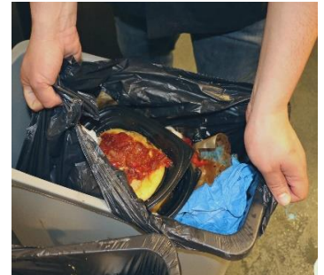
Tocar la basura