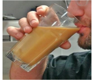
Comer o beber