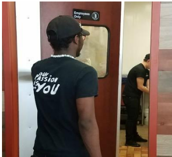
Trabajar con comida