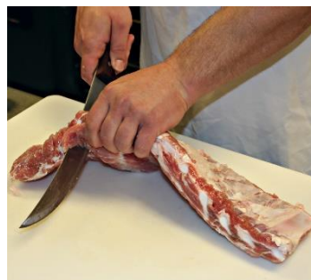
Tocar carne cruda o huevos