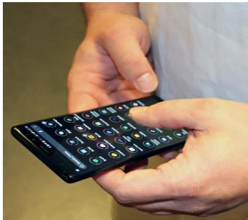
Tocar el teléfono