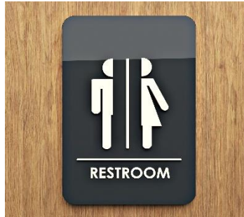
Usar el baño