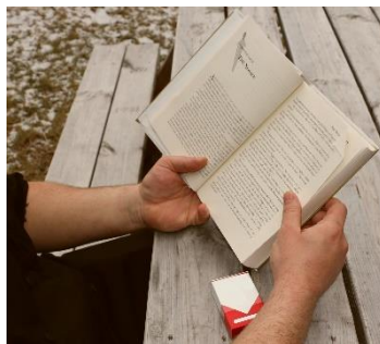
Fumar o tomar un descanso